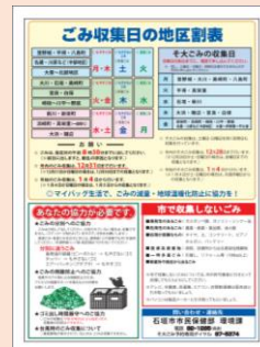
収集日の地区割り