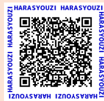
収集日の地区割り