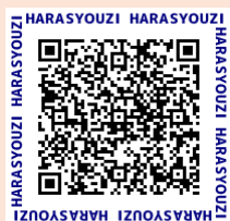
石垣市ごみ出し手引き