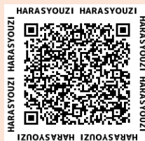
石垣市ごみ出し手引き