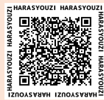
収集日の地区割り